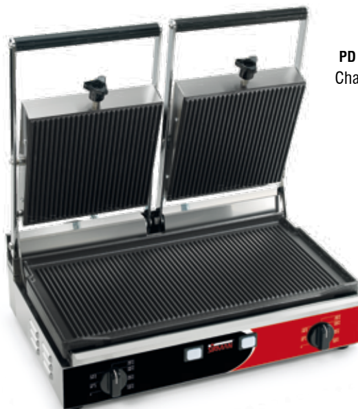
PD PS RR Chapas desmontáveis