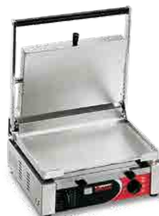
CORT XX TIMER