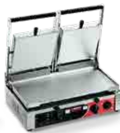
PD XX TIMER