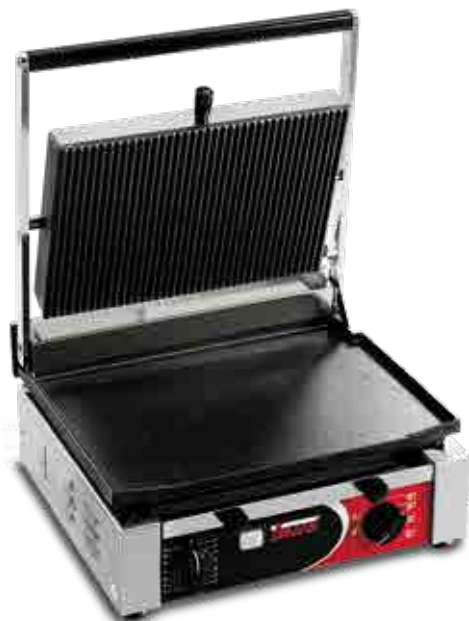
CORT LR CON TIMER