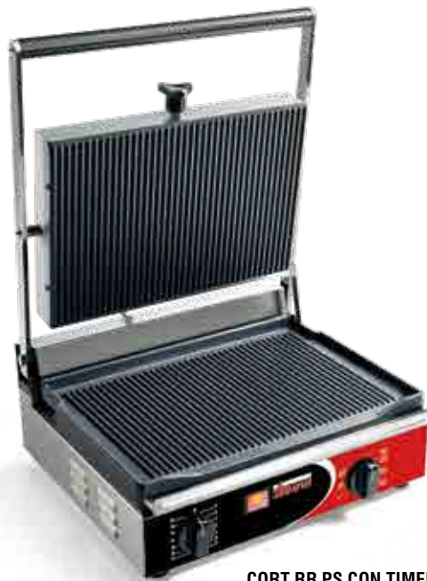
CORT RR PS CON TIMER