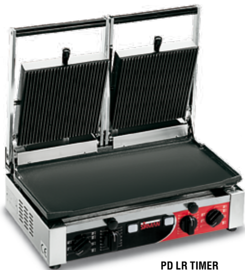
PD LR TIMER