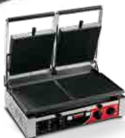
PD RR TIMER